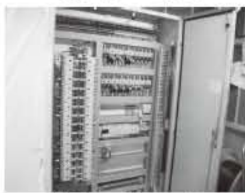
制御盤の内部の一部