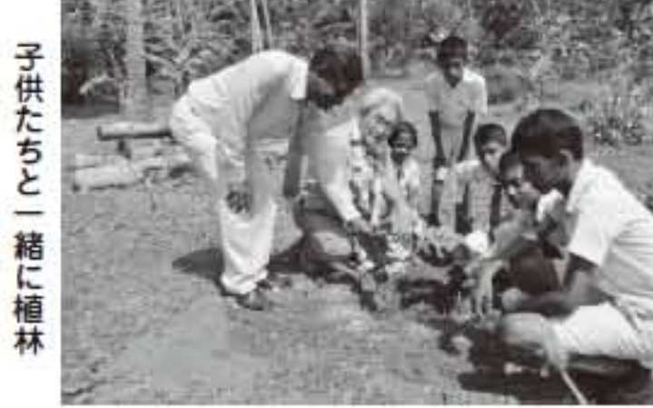
子供たちと一緒に植林

日本からの一行8人と現地オイスカの職員4名、保護者・教員・生徒ら総勢約180人。共に植林する様はまるでお祭り騒ぎ。瞬く間に予定の数を植え終えましたが、植えたのは木の苗だけでないという思いがしました。木を植えることの大切さと共に、日本とスリランカの友好の種も蒔いたとの実感を味わいました。