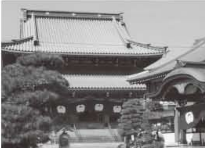
浄土真宗 西善寺 総面積3千坪 駐車場完備