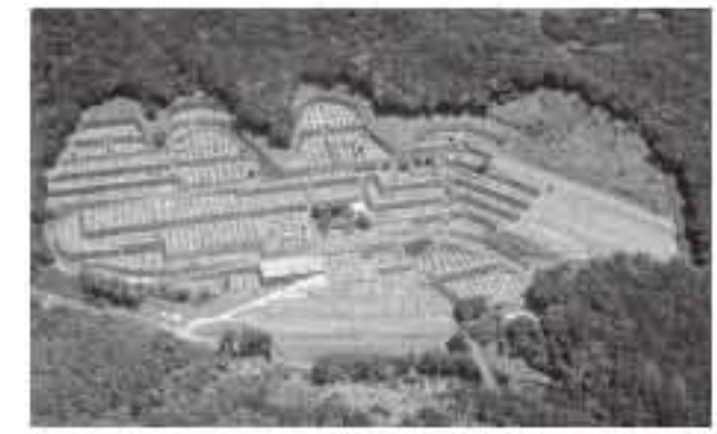
厚木霊園 総面積3万坪の大霊園

ザイン力、豊富な知識と経験に基づくアドバイスなどです。墓苑と霊園の経営には先ず、2~3千坪の土地の確保と拡張が必須であり、莫大な資金や販売の苦勞も伴います。今日の社大な霊園運営は、山本社長の数十年に及ぶ奔走と努力の成果といえましょう。「お墓は先祖と未来の絆、日本人の生きるよりどころでもあり、その心を大切にしたい」と山本社長。ただ、新たな墓苑と霊園経営は、物価の高騰や消費税により厳しく、目下、新事業を模索中だとか。弊社は墓苑と霊園、新社屋の電気工事でお付き合い頂いております。