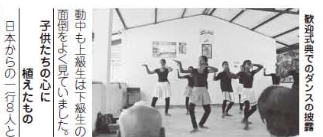
歓迎式典でのダンスの披露

期間中に2つの小学校を訪ね、一緒に木を植え子供たちと交流しましたが、どの学校でも大歓迎を受けました。会場には政府や郡の関係者も参加、今後は行政も「子供の森」プログラムを支援する旨の表明がありました。生徒は1年生から10年生迄一緒に勉強しており、活