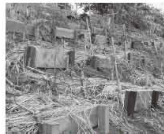
2014年7月に植樹された苗木

東日本大震災時、ポランティアとして現地に立った渋谷金隆社長は、宮脇昭氏の「命を守る森の防潮堤づくり」の運動を知りました。社業の家具とリホームは