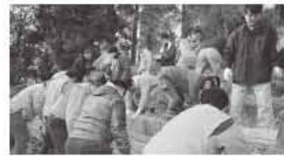
社員と地域の人々の森づくり