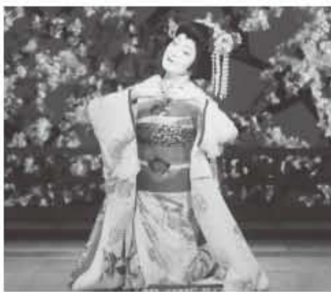
大和楽「祇園の夜桜」を舞う