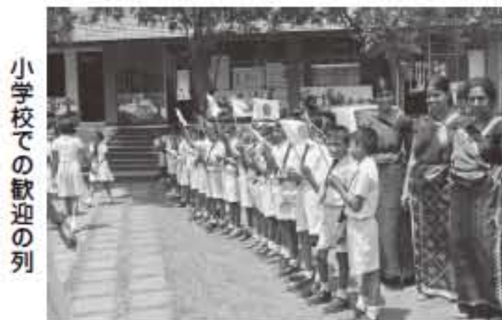
小学校での歓迎の列

「子供の森」計画とホンマ電機 オイスカが「子供の森」計画を開始して23年、今では世界30ヶ国と地域、学校数では5千校を数え