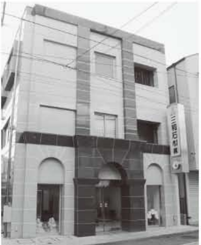
新社屋落成 小田急相模原駅の商店街 サウザンドロード