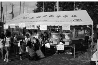
高校生の綿菓子店模擬店

第24回上鶴間地区ふるさとまつりは、8月18日(土)相模原市立谷口中学校校庭で実施されました。弊社は、毎年電気工事を委託されていますが、今年度は、社長が実行委員長を務めました。委員長は、谷口自治会と中和田自治会の会長が交互に勤めることになっています。