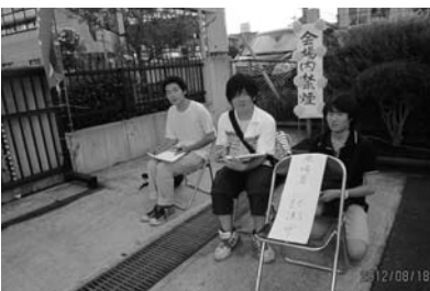
来場者をカウントする

模擬店の殆どが大盛況のうちには完売しました。上鶴間高校が授業でのケースメソッドとして今年特徴的だったことは、祭りの実行委員会に、上鶴間高校の学生さんが加わったことです。「アントレプレナーシップ教育」という授業の一環だ