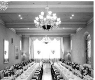
シャンデリアをLEDに交換