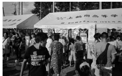
賑わう高校生の模擬店

社会に貢献することを学びます。一部の生徒は当日の準備作業も手伝いました。高校生は、「上鶴間地区ふるさとまつり」を題材に、授業でさまざまな角度から問題点を洗い出し、解決に向けて議論するのだそうです。