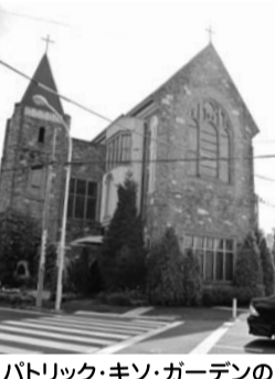
パトリック・キン・ガーデンの外観

パトリック・キン・ガーデン シャンデリアをLEDに交換 パトリック・キン・ガーデンは、町田街道木曾の交差点角に、ヨーロップの瀟洒なお城のようにそびえて建っています。キャッチフレーズはロイヤルシャトーウエディング。『お城と邸宅とガーデンを貸しきって、プリンセス気分を満喫する一日を提供』とあります。 また、『歴史ある古城、城内の緑豊かなガーデン、ゲストをおもてなしするための邸宅、そして最高のサービス、ヨーロップの上流階級の結婚式をイメージ』とあります。