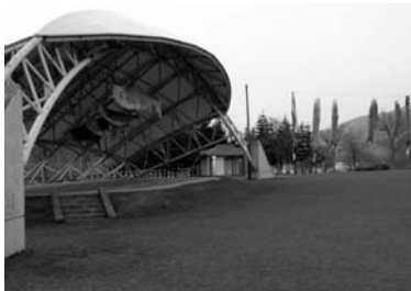
上記提案例(常設屋根つき) 黒石市

備といえます。そこでこのお荷物ともいえる親水設備を、写真のような常設野外ステージに改修し、様々なイベントに活用する提案です。例えばその活用は、夏の「もんじえ」や「新能」はもちろん、高校や大学の発表会あるいは舞台練習場として、更には野外コンサート会場としてなどいろいろ考えられます。特に有名アーティストのコンサートとなれば南関東エリアからの集客も期待され、相模大野の名は轟くことになりましょう。