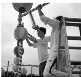
会場づくりを手伝う高校生

第24回上鶴間地区ふるさとまつりは、8月18日(土)相模原市立谷口中学校校庭で実施されました。弊社は、毎年電気工事を委託されていますが、今年度は、社長が実行委員長を務めました。委員長は、谷口自治会と中和田自治会の会長が交互に勤めることになっています。