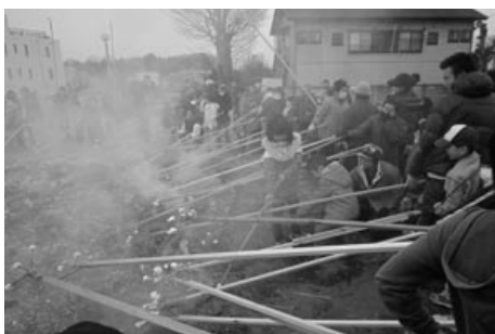
棒の先のステンレスの三叉に団子をさして焼く