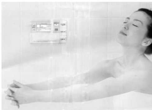
オール電化のエコキュートによる豊かな給湯・健やか入浴体験ナビ

付けて良かったの代表はオール電化です。理由は光熱費の一括管理や費用が抑えられたこととあり、特に昼間留守がちな家庭では半減する例もあります。 一方、付けて失敗のトップは、ビルトイン食器洗い乾燥機でした。少しの食器なら手で洗ったほうが早くて経済的。それに貴重な場所をとり、製造中止で代替がないという苦情も。その反面衛生的で付けて良かったとの声も多いのです。