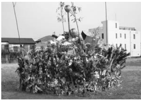
中和田 風の子広場でのどんと焼き

風の子広場では1月15(土)、どんと焼きが催され、小正月の行事として約300人が集い、持ち寄った正月の松飾りやしめ縄お札などを焚上げました。日本全国に伝わるお正月の火祭り行