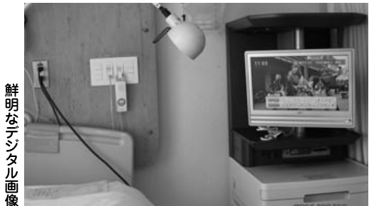
鮮明なデジタル画像

得ませんでした。また屋内配線はラン配線も兼ねているのでそのままでは使えず、新たな配線材の長さは5、000mにも上りました。さらに病院という特殊性から衛生、騒音、振動などには細心の注意を払っての施工が必要でした。また患者様の楽しみみの一つでもあるテレビが見られない時間を最小限にするために、スケジュールの打ち合わせは綿密に行われました。