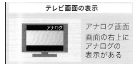
アナログ画面のテレビ表示

工事は予定の工期で完了。喜び。これで7月24日の鮮明なデジタル画像に患者様はじめ担当職員も大迎えることができます。