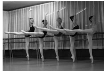
洗練としたレッスンの模様

員としても活躍。来る10月16日の県芸術祭作品(レ・パティヌール)として、県内40人の子どもを指導して参加する予定とか。 「コンクールで成果があるのは指導者としてやりがいを感じる」とも。同学園では、つくば国際バレエコンクールや全国プレバレエコンクールなどで幾人もが優秀賞や激励賞を受賞しています。 「大人も子どもも楽しんで観に来てくれる舞台を目指し、バレエファンを地域に増やしたい」と語る。「夏にエアコンが停止しホンマ電機がすぐ処置を。エコエアコンによる低料金の提案もなされました」