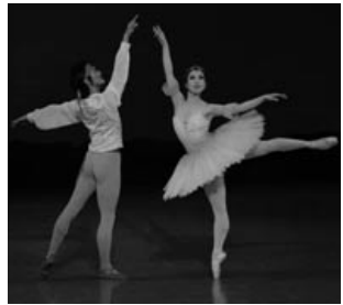
2010年の発表会バレエ「海賊」より