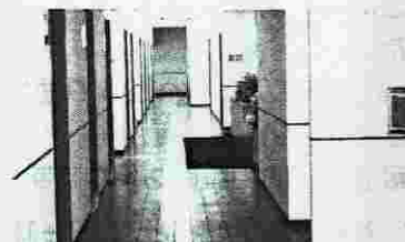
ずらりと並んだカラオケの個室