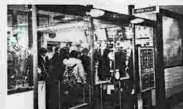
若者で賑わうマクドナルド