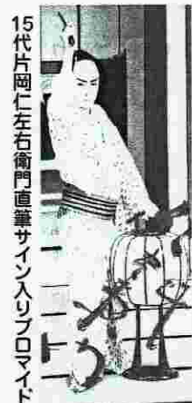
15代片岡仁左衛門直筆サイン入りプロマイド