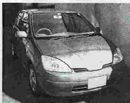
エコカー(ハイブリットカー)の例:プリウス

今日、世界各地で発生している異常気象による気象災害。これらの原因として地球の温暖化が大きく影響していることは既に分かっています。そして温暖化の促進要因が、二酸化炭素等の温室効果ガスであることも分かっています。近年の気象災害の例に次のよ