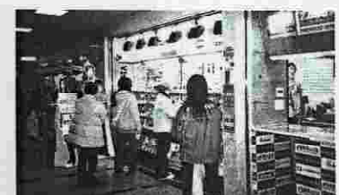
若者に人気、携帯の王様