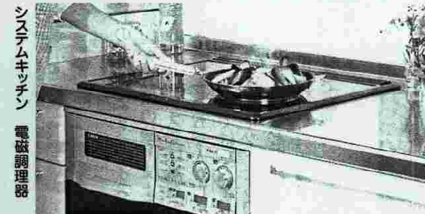
システムキッチン 電磁調理器

この事により、大型ルームエアコンの導入は各戸の停電時間を最小にすることに配慮され、勿論、IH調理器・衣類乾燥機などの二〇〇ワット幹線ルートを新規に設定し、美観に配慮してスリムダクト配線として