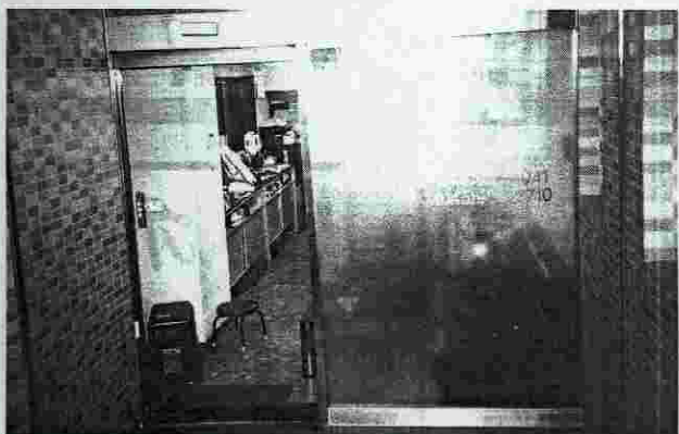
開誠産業の事務所入口