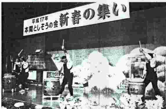
御園太鼓親和会の祝い太鼓