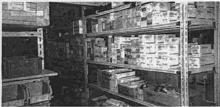
管理しやすくなった資材倉庫内