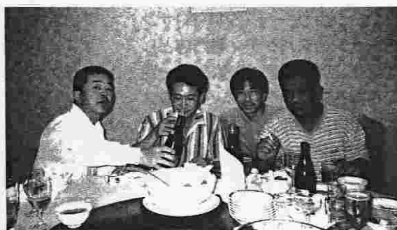
さあ、これから頑張って下さいと、もう一杯