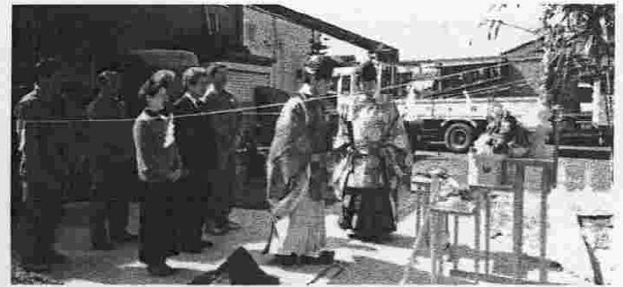
工事の安全を願って地鎮祭(平成13年3月8日)

サービスマンが事務所と車両置き場、さらにはフロントと近いということは、機動時の利便性に現れ、フロントとの意思疎通も円滑になります。