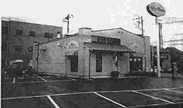
ジョリーパスタの真新しいおしゃれな店舗全景