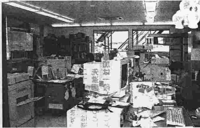
OA化とIT化が図られているオフィス内