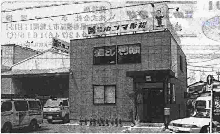
完成した新しい社屋と資材倉庫(奥側)