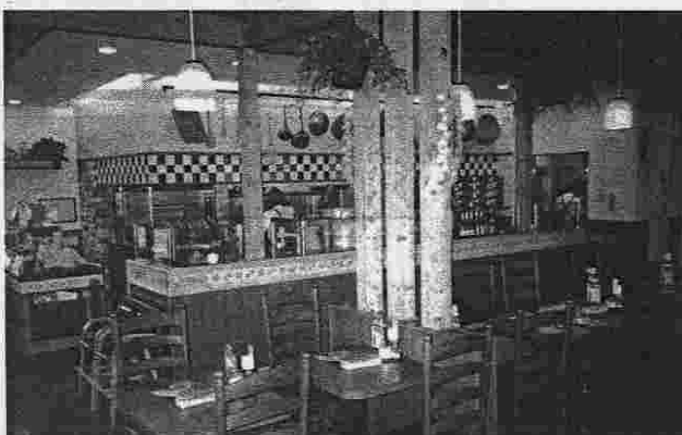
パスタの調理道具をインテリアとしている楽しいカウンター